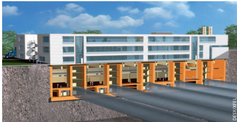
So könnte das Hauptgebäude des europäischen Röntgenlasers XFEL aussehen. In der unterirdischen Experimentierhalle (orange) enden die Tunnel, die die Röntgenblitze zu den Experimenten leiten.

Von Datenbanken für die Sozialwissenschaften und die Biomedizin über ein Observatorium auf dem Meeresboden bis hin zum Europäischen Röntgenlaser XFEL und dem Beschleunigerzentrum FAIR reicht die Liste von 35 Projekten, die das European Strategy Forum for Research Infrastructure (ESFRI) in die erste Roadmap für die europäische Forschungsinfrastruktur aufgenommen hat. Diese enthält gleichermaßen Projekte, die bereits im nächsten Jahr realisiert werden könnten, als auch solche mit einem Zeithorizont von fast zwei Jahrzehnten. Ihnen allen gemeinsam sind sowohl die wissenschaftliche als auch eine gesamteuropäische Bedeutung. So breit gefächert die Disziplinen der Projekte sind, so unterschiedlich ist auch ihr Finanzbedarf – dieser reicht von 9 bis zu 1186 Millionen Euro – sowie ihre Reife. Die Mitte Oktober veröffentlichte Roadmap, an der über 1000 Experten beteiligt waren, enthält allerdings weder eine vergleichende Gegenüberstellung der Reifegrade