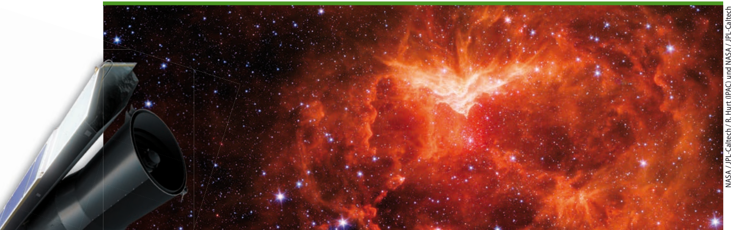
NASA / JPL-Caltech / R. Hurt (IPAC) und NASA / JPL-Caltech

Nach 16 Jahren im All hat die NASA das Spitzer-Weltraumteleskop Ende Januar in einen Ruhezustand versetzt und die Mission damit beendet.