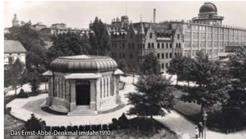
Das Ernst-Abbe-Denkmal im Jahr 1910

Ernst Abbe führte die Verwissenschaftlichung des optischen Gerätebaus ein. An der in seiner Mikroskoptheorie begründeten Auflösungsgrenze für Mikroskope rieben sich ein Dutzend Jahrzehnte die Physiker,