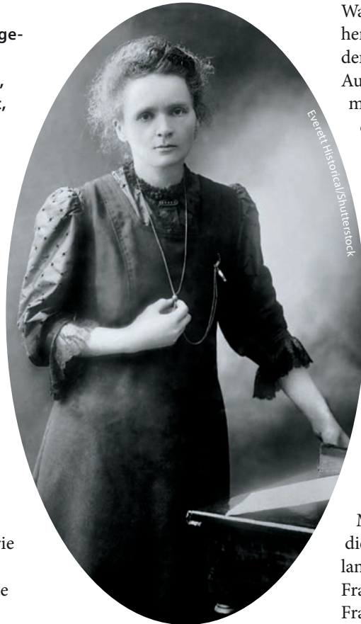
Marie Curie (1867 – 1934)

Als Maria Skłodowska wird die spätere Marie Curie am 7. November 1867 im russisch verwalteten Polen in eine Akademikerfamilie geboren. Damit gehört sie nach Herkunft und Generation zu einer bildungsgeschichtlichen Schlüsselgruppe in der Geschichte ihres Landes. Ähnlich den russischen Nihilisten, aus deren Umfeld die eine halbe Generation ältere Mathematikerin Sofia Kovalevskaja stammte,