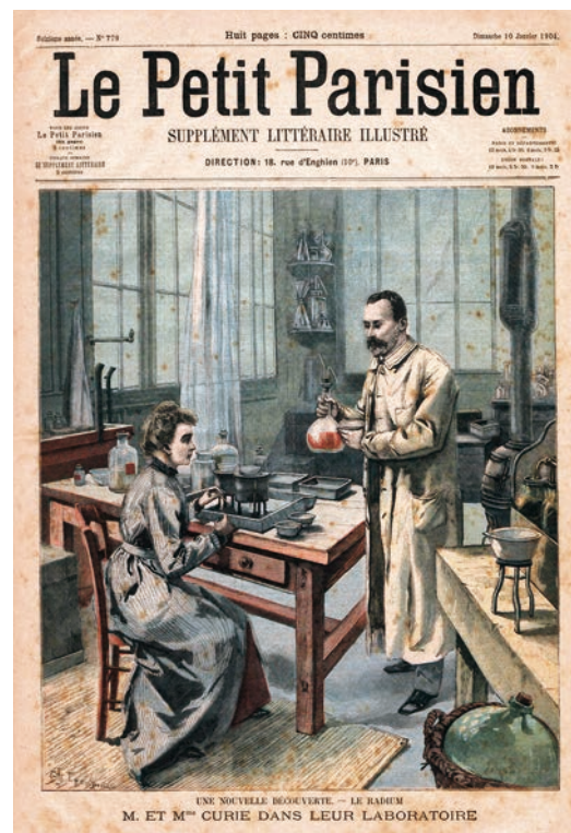
Nach der Nobelpreisverleihung berichten Zeitungen und Zeitschriften aller Art über Marie und Pierre Curie.