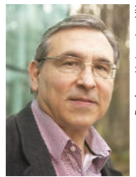
Carlos S. Frenk

■ Die DPG verleiht gemeinsam mit dem britischen Institute of Physics (IOP) jährlich den Max-Born-Preis in Erinnerung an das Wirken des Physikers Max Born (1882 – 1970) in Deutschland und Großbritannien. Der erstmals 1973 verliehene Preis wird abwechselnd einem britischen und einem deutschen Physiker zuerkannt. Er besteht aus einer Urkunde, einer silbernen Gedenkmedaille und einem Geldbetrag.