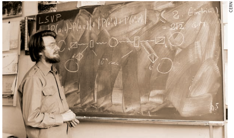
Der irische Physiker John Bell, hier im Jahr 1982 am CERN, zeigte 1964 mathematisch, dass sich die Quantenmechanik

Vor etwas mehr als fünfzig Jahren hat der irische Physiker John Bell jedoch gezeigt, dass eine solche Komplettierung nicht ohne Weiteres möglich ist [2]. Er betrachtete dabei eine beliebige physikalische Theorie, die folgende Bedingungen erfüllt: Physikalische Effekte breiten sich nicht instantan im Raum aus (Lokalität), physikalische Eigenschaften sind unabhängig von einer Messung und liegen bereits davor fest (Realismus), und ein Experi-