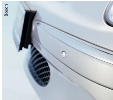
Abb. 2 Die Ultraschallsensoren sind in die Stoßfänger integriert und in Fahrzeugfarbe lackiert. Vier davon decken ein Feld von 1,5 m Tiefe lückenlos ab.

Eine ISO-Norm legt fest, dass eine Pkw-Einparkhilfe noch ein Rohr mit 7,5 Zentimeter Durchmesser erkennen muss. Die typische Reichweite eines Gesamtsystems liegt bei etwa 1,5 Metern, der Minimalabstand, um ein Hindernis sicher detektieren zu können, beträgt 15 bis 30 Zentimeter. Er ergibt sich aus der Zeit, die die Membran zum Ausschwingen benötigt – ein bis zwei Millisekunden –, erst dann kann der Sensor das Echo zuverlässig detektieren.