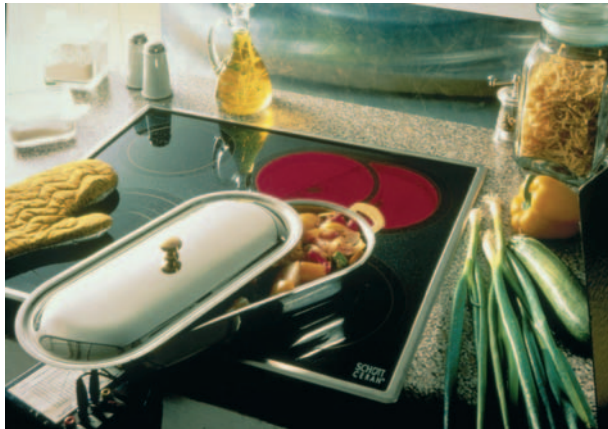
Abb 1: Ceran-Kochfelder vereinigen die vorteilhaften Eigenschaften von Glas und Keramik.

Glaskeramik ist aus unseren Küchen nicht mehr wegzudenken. Als Kochfläche für Elektroherde hat sich dieses Material durchgesetzt, denn es ist gleichzeitig temperaturbeständig, hart wie Keramik und transparent wie Glas.