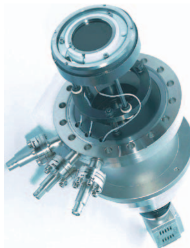
Moderner 2D-CCD-Detektor für die winkelaufgelöste Spektroskopie (SPECS, Berlin)