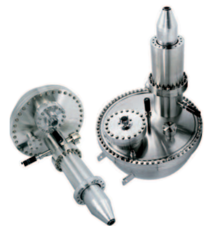
Elektronenspektrometer PHOIBOS 100/150 (SPECS, Berlin)