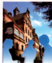
Physikzentrum Bad Honnef Ein Platz für Dialog und Inspiration

In den vergangenen 30 Jahren hat sich das Physikzentrum der DPG in Bad Honnef zu einer Kommunikationsstätte der Physik mit weltweiter Ausstrahlung entwickelt. Der großformatige und großzügig bebilderte Band „Physikzentrum Bad Honnef – Ein Platz für Dialog und Inspiration“ (107 S.)