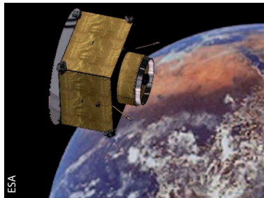
Abb. 2 Der geplante Satellit HYPER soll atomare Inertialsensoren tragen.

Auch Satellitenmissionen wie HYPER (Abb. 2) [5] zur Messung