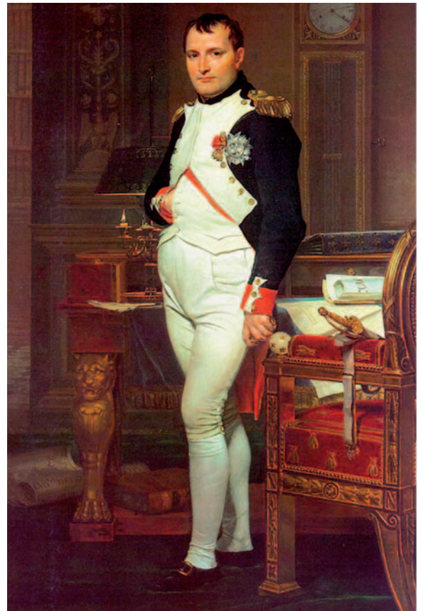
Am Hofe von Kaiser Napoleon Bonaparte (1769 – 1821) bekleideten führende Naturwissenschaftler wie der Mathematiker Laplace oder der Biologe La Cépède hohe Ämter.

Am nächsten Morgen erhält Chladni eine Gratifikation von 6000 Francs, verbunden mit dem Wunsch, die „Akustik“ in französischer Sprache herauszugeben. Hierbei stößt Chladni auf ein Problem [5]. Die französische Sprache kennt für die Begriffe „Schall“, „Klang“ und „Ton“, die Chladni in unterschiedlichen Bedeutungen verwendet, nur das eine Wort „son“. Ein Franzose, zu dieser Gelegenheit befragt, kann ihm nur