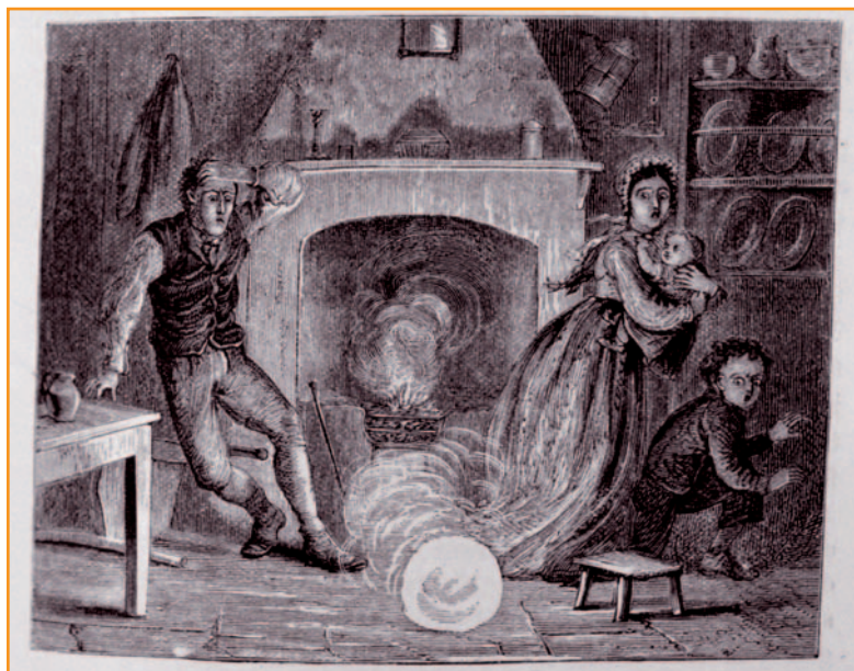
Kugelblitze sorgen gleichermaßen für Faszination und Schrecken, wie diese Darstellung aus einem populärwissenschaftlichen Buch von 1886 zeigt.

Seit dem Altertum haben Augenzeugen von Kugelblitzen berichtet. Die zusammengetragenen Berichte ergeben folgendes Bild hinsichtlich der beobachteten Größen, Farben und Lebensdauern: Kugelblitze weisen Durchmesser zwischen 2 cm und 2 m auf, am häufigsten 5 bis 50 cm. Die Lebensdauer liegt meist zwischen 1 und 4 Sekunden, aber es sind auch schon Dauern von über 2 Minuten beobachtet worden [1]. Kugelblitze treten meist bei Gewittern auf, aber auch in der Nähe von Starkstrom-Anlagen. Die gesamte undurchsichtige Kugel glüht homogen und verändert ihr Aussehen bis zum Erlöschen oder Explodieren nicht. Sie treibt nicht aufwärts wie heiße Luft, sondern