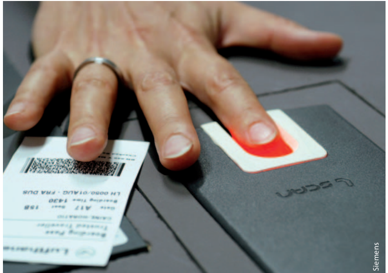
Gemeinsam mit Siemens hat die Luft-hansa ein biometrisches Check-in- und Boarding-Verfahren getestet, das Flug-gäste per Fingerabdruck identifiziert.

Fingerabdruck-Sensoren arbeiten heute meist mit optischen