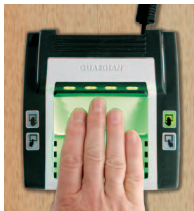
Cross Match Technologies

Neuere Sensoren nutzen Ultraschall zur Abtastung der Fingerkuppe und bilden diese anhand der Echostärke ab. Da Ultraschallwellen weit in menschliches Gewebe eindringen, liefert ein Ultraschallsensor sogar bei verletzten, ver-