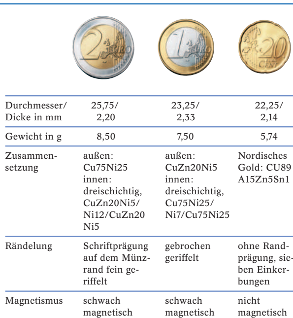
Tabelle: Technische Daten einiger Euro-Münzen

Um die gewünschten hohen Trefferquoten zu erreichen – mindestens 99,9 % der eingeworfenen Geldstücke sollen korrekt identifiziert werden –, kombiniert man die induktive Leitfähigkeitsmessung noch mit einer Reihe anderer Methoden. Da Blei eine ähnliche Leitfähigkeit hat wie manche der für Münzen verwendeten Legierungen, waren Imitate aus Blei oft eine beliebte Fälschungsmethode. Um solche Kandidaten auszusortieren, wird in manchen Automaten ein Härtetest durchgeführt, der ein wenig an den alten „Bisstest“ für Goldmünzen erinnert. Während Olympiasieger gerne demonstrativ ihre neue Goldmedaille zwischen die Zähne nehmen, rollen die Prüflinge im Automaten über eine kleine harte Kugel, die auf einem Piezo-Element liegt. Weichere Münzen verformen sich dabei ein klein wenig mehr als harte Münzen, und man erhält am Piezo-Element leicht unterschiedliche Spannungen. Diese relative Härte wird wieder mit