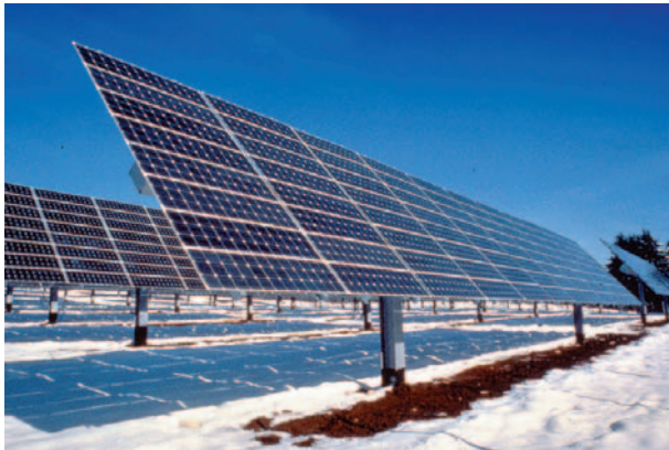
Abb. 1: Mittlerweile lässt sich mit Solaranlagen auch im größten Maßstab Strom erzeugen. Die bläulich schimmernde Farbe der Solarzellen geht übrigens auf eine Antireflectionsschicht zurück, die auf die Oberseite aufgebracht wird.

So wie das Sonnenlicht hat gewissermaßen auch die technische Solarenergienutzung einen Weg aus dem Weltraum hinab zur Erde zurückgelegt. Einer der ersten