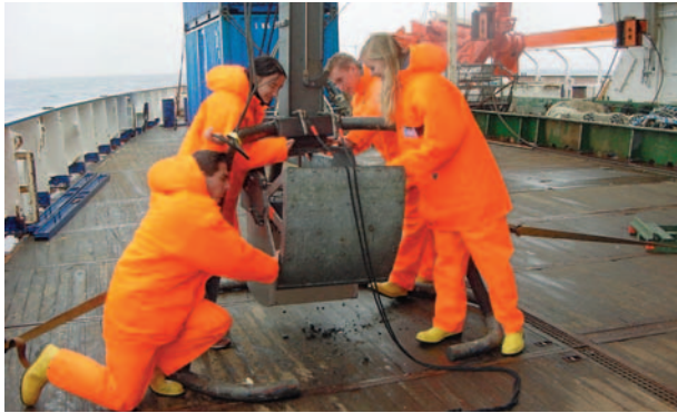
Auf dem Arbeitsdeck des Forschungsschiffs Polarstern entnehmen Auricher Schüler dem Kastengreifer Proben des antarktischen Meeresbodens.