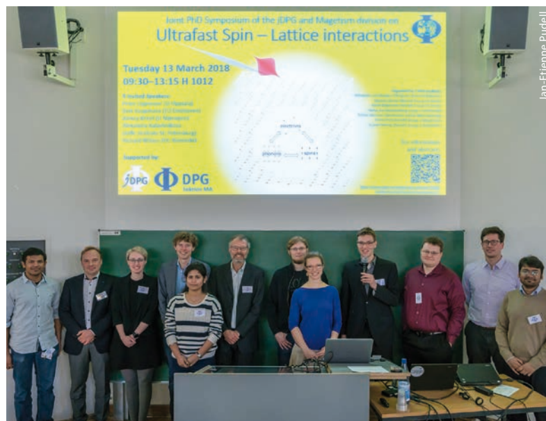
Teilnehmer und Organisatoren des Berliner PhD-Symposiums zum Thema „Ultrafast Spin-Lattice Interaction“ auf der

Die Initiative zum Symposium auf der Berliner SKM-Tagung entstand auf der „Bad Honnef Physics