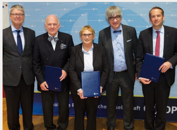
DPG / Heupel 2018

der DPG zu ausländischen Partnergesellschaften. Sie war und ist Mitglied in verschiedenen Gremien der DPG, hat sich aber auch weit über die damit verbundenen Aufgaben hinaus mit hohem persönlichen Einsatz und weitem internationalen Horizont für die Belange der Physik engagiert.