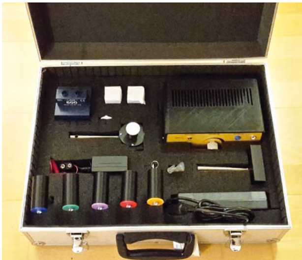
Abb. 4 Der Ergänzungsbaukasten zur Faraday-Rotation enthält nur diejenigen Teile, die nicht in der Grundausrüstung für optische Experimente vorhanden sind.

wortlichen Elektronen, also ein Teil der schwächer gebundenen Valenzelektronen. In den 1970er-Jahren war es üblich, mit der Faraday-Rotation die effektive Masse der Elektronen in Halbleitern zu bestimmen. Heute dient sie in speziellen Materialien dazu, optische Isolatoren bei Hochleistungslasern zu realisieren oder äußerst kleine Flussdichten im Nano-Tesla-Bereich in Lichtwellenleitern zu messen.