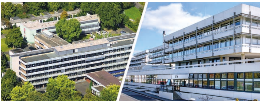
Der City-Campus (links) und der Faßberg-Campus des neuen Max-Planck-Instituts für Multidisziplinäre Naturwissenschaften