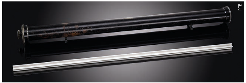
Bis 1960 diente die Kopie Nr. 23 des Urmeters als Normale für die Längenmessung in der Bundesrepublik Deutschland.

Bis 2018 ergaben sich alle Basiseinheiten aus einer Definition, die gleichzeitig die Realisierung des Prototypen angab: „Die Basiseinheit X entspricht...“. Genauere Verfahren, zum Beispiel der Übergang vom Urmeter auf einen Bezug zur