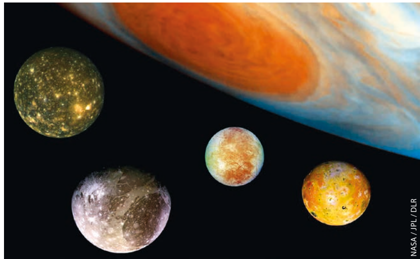
Jupiter und seine Eismonde (von links) Callisto, Ganymed und Europa stehen im Mittelpunkt der Juice-Mission. Der vulkanisch aktive Mond Io (rechts) ist dem Planeten am nächsten.

Aufbauend auf früheren Ergebnissen der Sonden Voyager I und II sowie des Galileo-Orbiters dürfte bei allen drei Monden flüssiges Wasser unter einer Eisschicht existieren. Bei Europa wird vermutet, dass der Ozean unter dem nur wenige Kilometer dicken Eispanzer sogar über 100 Kilometer tief ist. Im Inneren von Callisto und Ganymed haben Magnetfeldmessungen ebenfalls Hinweise auf Wasserschichten geliefert, allerdings vermutlich in größerer Tiefe. Die Erforschung dieser Ozeane ist auch im Hinblick auf mögliches Leben dort von Interesse. Juice soll die Eismonde genauer charakterisieren und klären, ob es diese Ozeane wirklich gibt. Darüber hinaus soll die Sonde die Magnetfelder von Jupiter