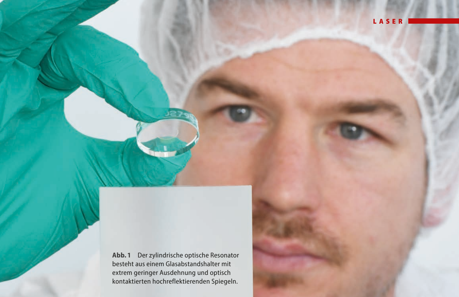
Abb. 1 Der zylindrische optische Resonator besteht aus einem Glasabstandshalter mit extrem geringer Ausdehnung und optisch kontaktierten hochreflektierenden Spiegeln.